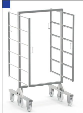
WÓZEK WĘDZARNICZY TYP H