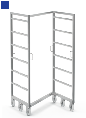
WÓZEK WĘDZARNICZY TYP Z