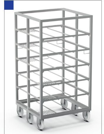
WÓZEK WĘDZARNICZY TYP O